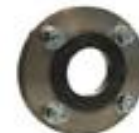
BRIDA CIEGA COMPLETA PARA BATERIA