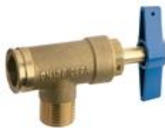
VALVULA DE SALIDA CONTADOR DE 15mm