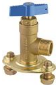
VALVULA ENTRADA CONTADOR 15mm