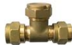
TE PURGA Y COMPROBACION 15mm