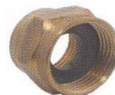
TUERCAS PARA LA CONEXIÓN DE LLAVE Y CONTADOR