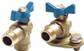
KIT DE LLAVES DE ENTRADA/SALIDA DE BATERIA